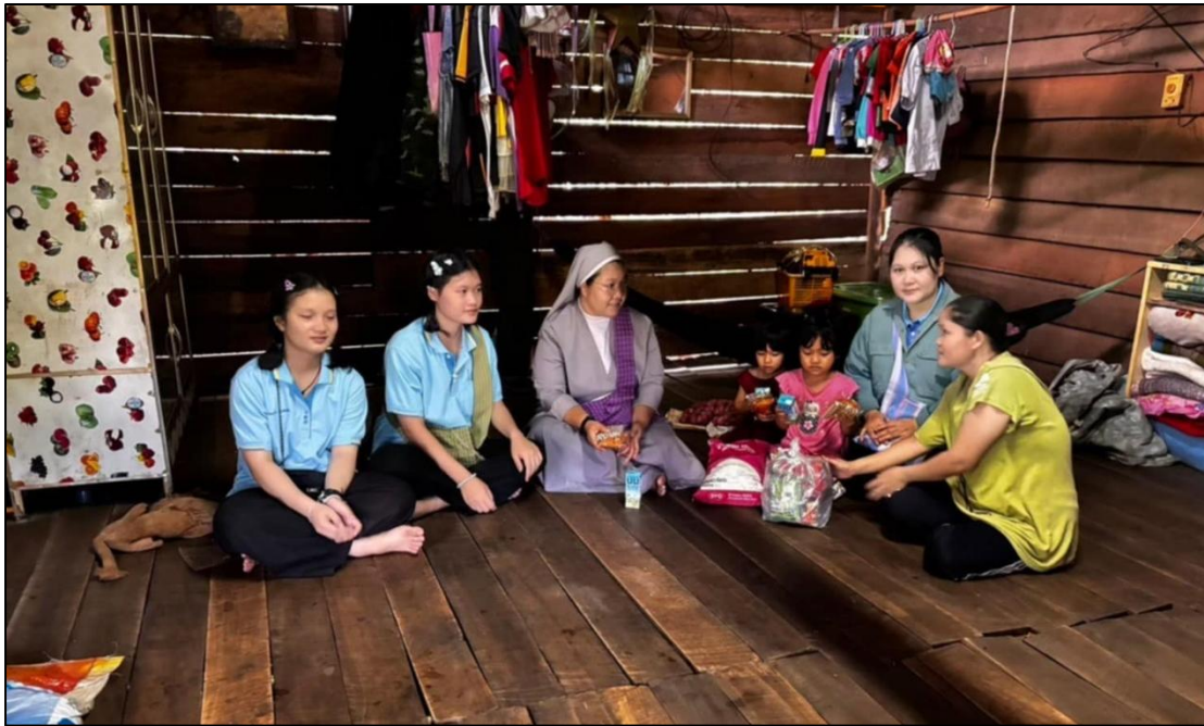
คณะเซอร์ ครู และผู้นำนักเรียนร่วมกันแจกถุงยังชีพแก่ผู้ป่วยและคนพิการในชุมชน