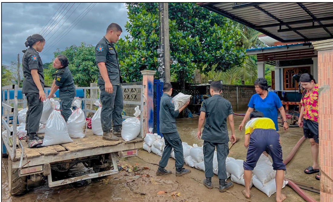
นักศึกษาวิชาทหารโรงเรียนเซนต์โยเซฟแม่ระมาดจิตอาสา เข้าร่วมพัฒนาทำความสะอาดพื้นที่ ที่เกิดอุทกภัย ในหมู่ 3 อำเภอแม่ระมาด จังหวัดตาก