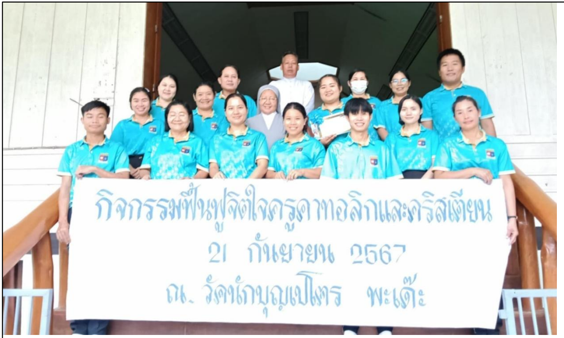
คณะเซอร์ และ ครู เข้าร่วมกิจกรรมฟื้นฟูจิตใจครูคาทอลิกและคริสเตียน