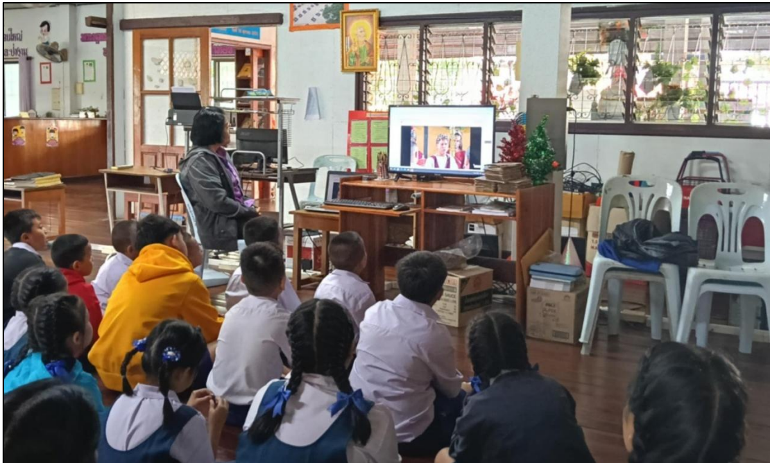
กิจกรรมการจัดการเรียนการสอนจริยะเป็นการสอนคุณธรรมจริยธรรมโดยการสอดแทรกค่านิยม ที่พึงประสงค์