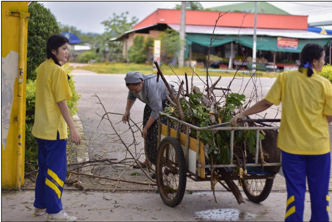
ผู้บริหารนำคณะครูและนักเรียนร่วมกันปรับปรุงทัศนียภาพภายในโรงเรียน เพื่อสร้างบรรยากาศที่ ร่มรื่นและน่าเรียนรู้