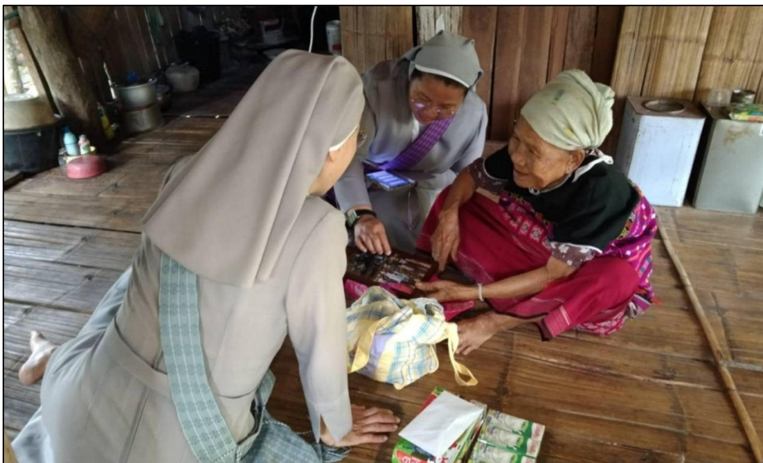
คณะเซอร์และผู้นำนักเรียนร่วมกันแจกถุงยังชีพแก่ผู้สูงอายุในชุมชน เพื่อช่วยเหลือและให้กำลังใจ