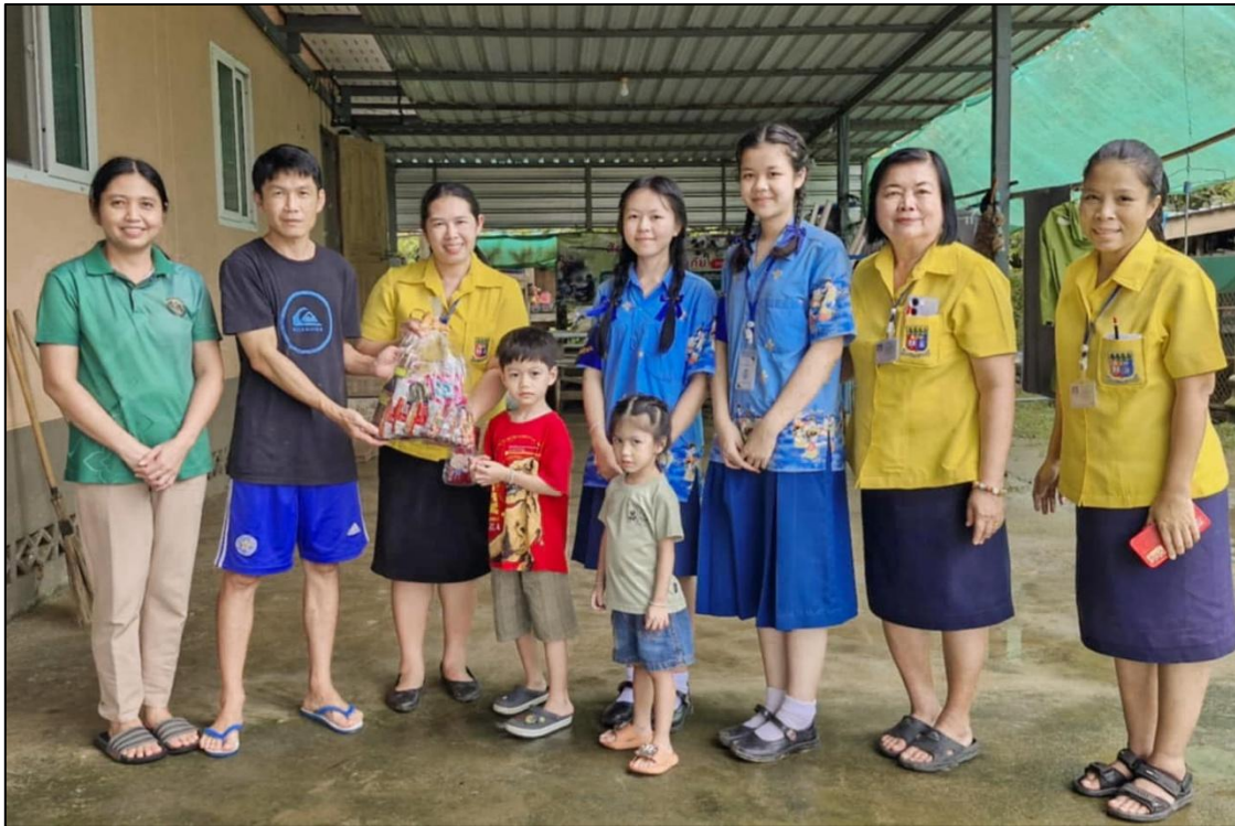
ตัวแทนคณะครู และสภานักเรียนโรงเรียนเซนต์โยเซฟแม่ระมาดเข้าเยี่ยม ผู้ปกครอง และนักเรียน ที่ประสบภัยจากน้ำท่วม ในพื้นที่อำเภอแม่ระมาด เพื่อพบปะพูดคุยและให้กำลังใจ พร้อมทั้งมอบ เครื่องอุปโภคบริโภคและของใช้ที่จำเป็น